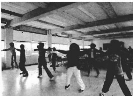
写真1 新潟中央短期大学学部2年生によるミュージカルに向けたダンスの練習の様子