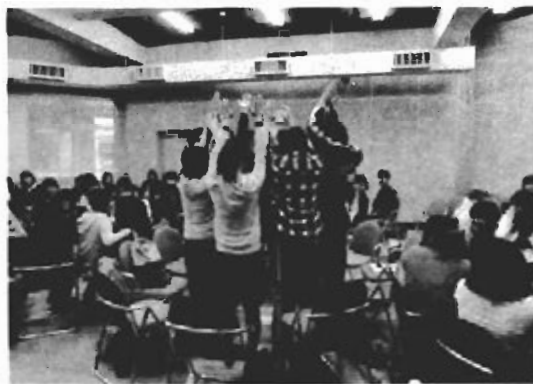
写真2 上越教育大学学部3年生による表現活動を発表し合う授業の様子