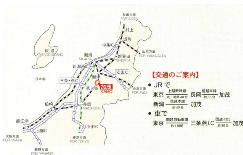
[加茂市ホームページより]